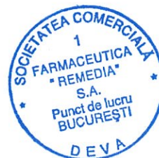
Secretarul Adunării Generale Ordinare a Acționarilor